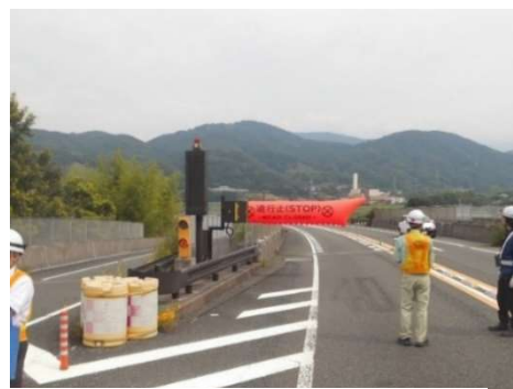
【大平 IC 遮断機】

※遮断機の操作訓練に合わせて、月ヶ瀬 IC 下り線、大平 IC 上り線において、それぞれ時間帯を分けて通行止めを行います。詳細の予定については別紙をご確認ください。