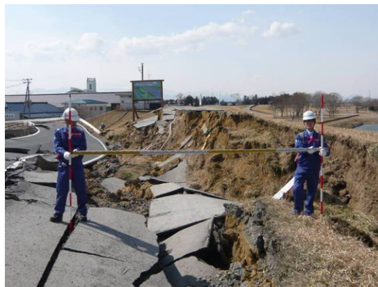
① 鳴瀬川における堤防被災調査状況