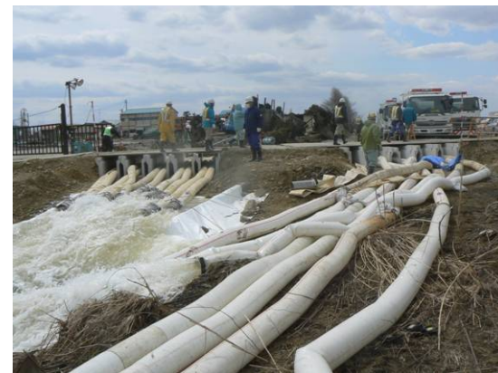
③ 排水ポンプ車活動状況