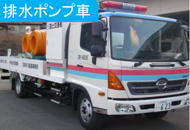
15m 3 /min 高揚程水中モーター式