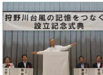
平成26年9月29日設立記念式典