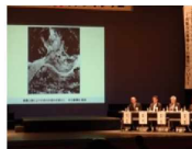
シンポジウム等の開催