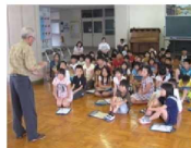
学校・地域での学習