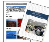
副読本・教材制作