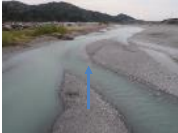
大井川用水水路橋下流側(21.0km付近)(3月23日)