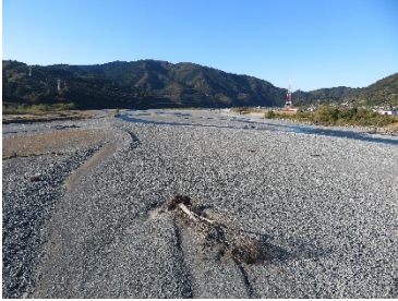
大井川用水水路橋上流(21.0km付近)(12月3日)