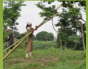
河道内樹木伐採作業