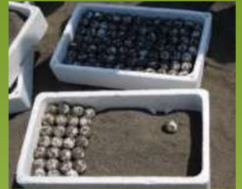
希少種保護(ウミガメの保護)