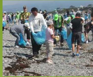
海岸環境の維持(清掃活動)