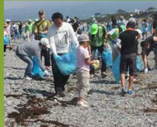
海岸環境の維持(清掃活動)