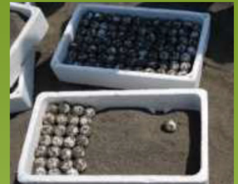
希少種保護(りさめ)の保護