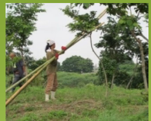
河道内樹木伐採作業