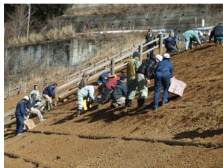
やっと半分まで完了(お疲れ様です)