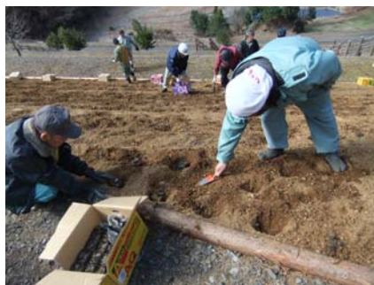
植栽穴、多すぎでは？