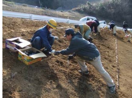
抜群のチームワークで植栽しています