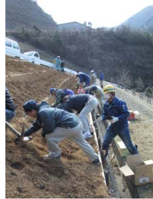
後少しで植栽完了です！

さて、これで終わりではありません。 次は、シダレザクラとドウダンツツジの植樹です。