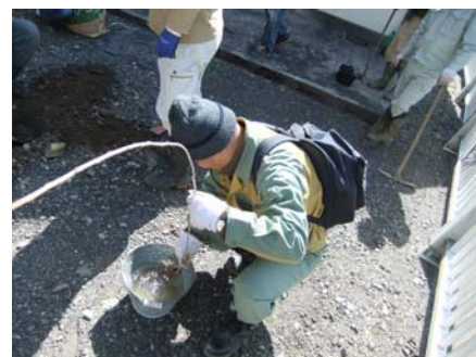
2. 苗が乾燥しているので、根を水で濡らします