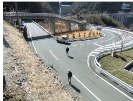
交通誘導員も配置します