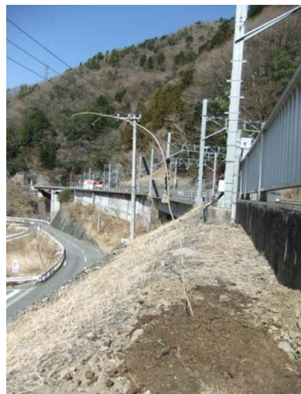
4. 水をかけて完成です