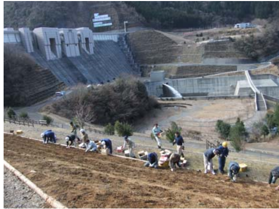
長島ダムをバックにパチリ