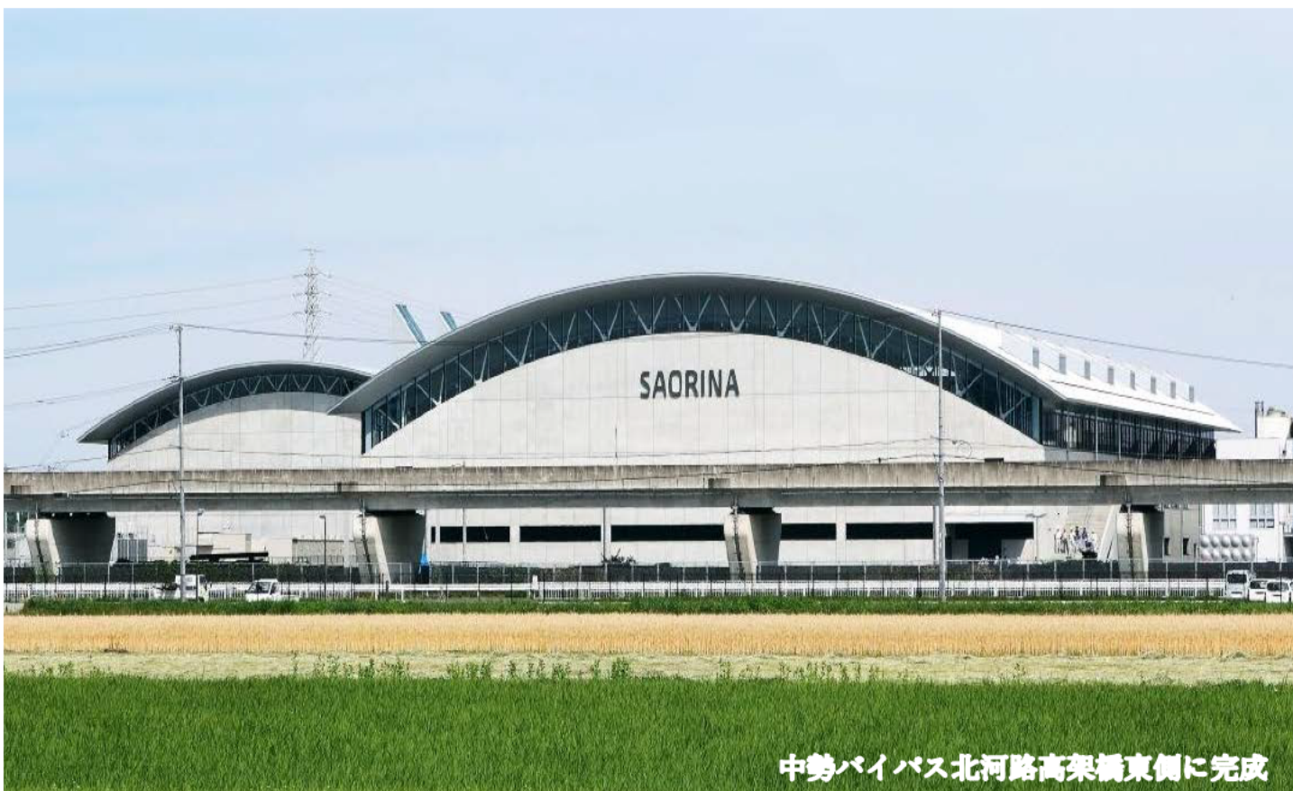
中勢バイパス北河路高架橋東側に完成