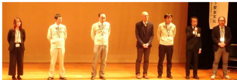
各支部長の決意表明