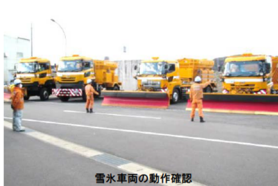
雪氷車両の動作確認

雪氷対策期間を迎えるにあたり、平成29年12月1日、国道25号守田基地において、三重県内の国道事務所(三重河川国道事務所・紀勢国道事務所・北勢国道事務所)、三重県警察、雪氷・維持業者と出陣式を行いました。その後「道の駅いが」に移動し、大雪等により立ち往生した車両を速やかに移動させ、道路交通を確保することを目的として、三重県レッカー事業協同組合、JAF、維持業者とともに車両移動訓練を行いました。三重県では、ノーマルタイヤの車両がわずかな積雪で立ち往生し、交通障害を引き起こすことがあります。私たちも地域の皆様に安心安全な道路を利用していただけのように雪氷対策に万全を尽くしていきます。ドライバーの皆さんには、なれない雪や路面凍結に備えて 早めの冬装備 をお願いします。