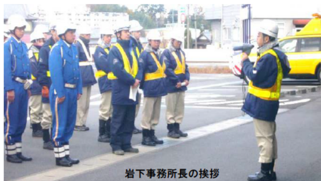
岩下事務所長の挨拶