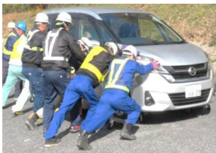
立ち往生車両を想定した車両移動訓練の様子

ノーマルタイヤから スタッドレスタイヤ 等の冬用装備に替えるのはもちろんですが、 走路の積雪や凍結には十分注意して走行して下さい。