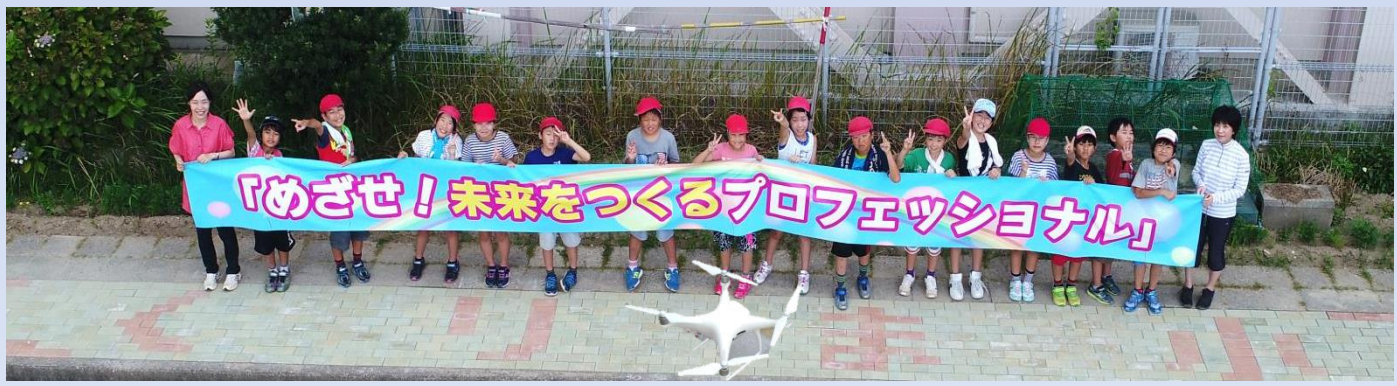
ドローンから撮影

インターロッキングによる「くりま小」の道づくりです。東海土建のお兄さん達の説明をしっかりと聞きながら、砂を平らにならしたり、角をしっかりとあわせたり、上手くはならず、思ったより大変だった所もあったけれど最後までみんな一生懸命に取り組んでくれました。