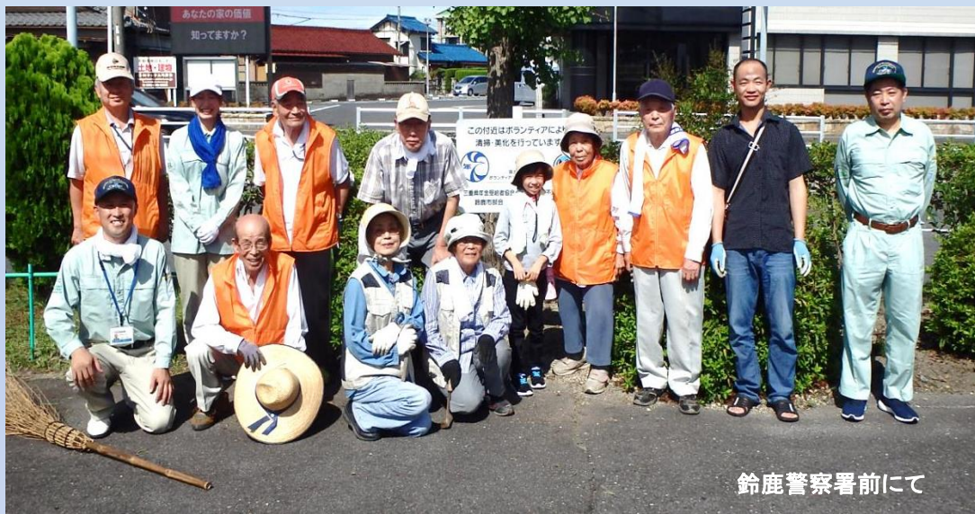
鈴鹿警察署前にて

8月13日(日)三重県年金受給者協会の皆様方と清掃活動に参加させて頂きました。当日は、白子小学校のかわいいお友達の参加もあり、総勢14名で楽しく作業させて頂き、交流を深めることができました。日頃の皆様の活動並びにご協力に感謝し、私たちも「安心・安全」な道路を提供できるように維持管理に努めていきたいと思っております。