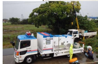
津市に設置した排水ポンプ車