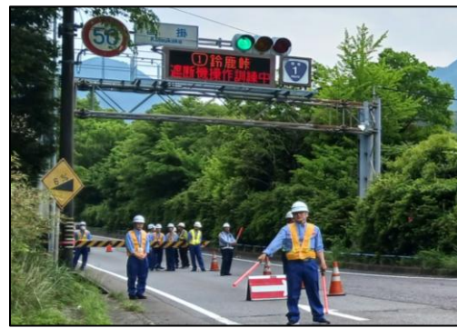
【沓掛ゲート】昨年度の遮断機操作訓練の様子