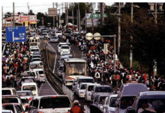
帰宅する自動車と駅へ向かう歩行者で混乱