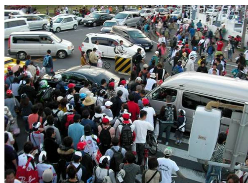
レース終了後、観戦者が集中するサーキット交差点