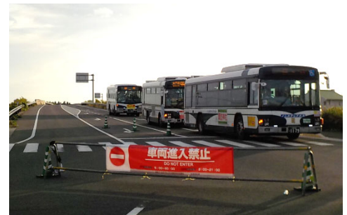
規制状況、シャトルバス運行状況