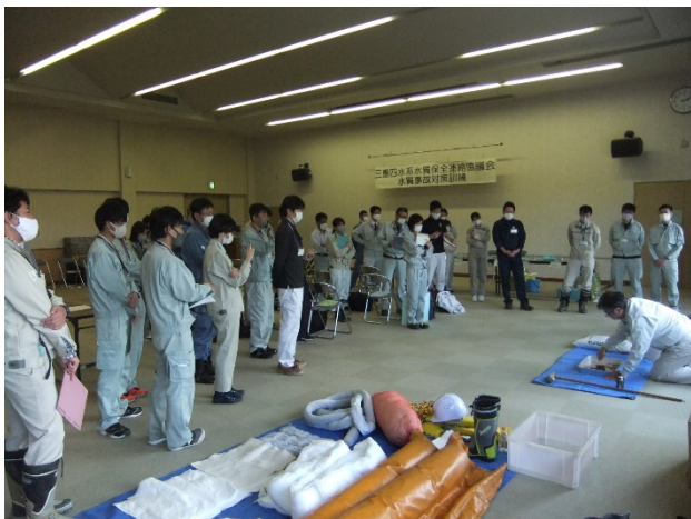
【講習】油類による水質事故対応