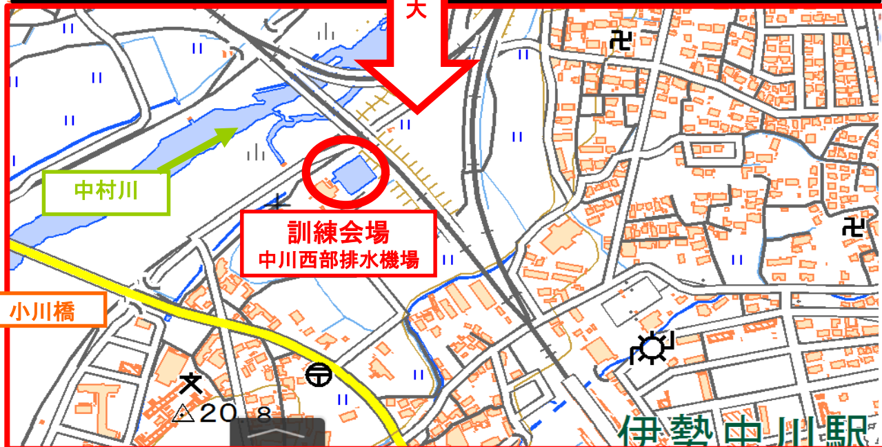
～訓練スケジュール～