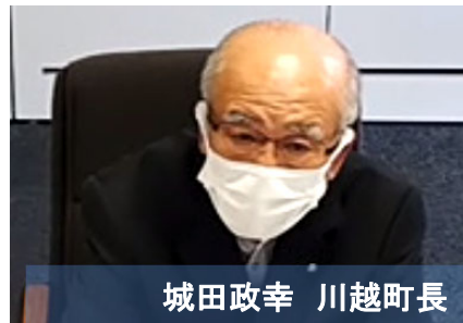
城田政幸 川越町長