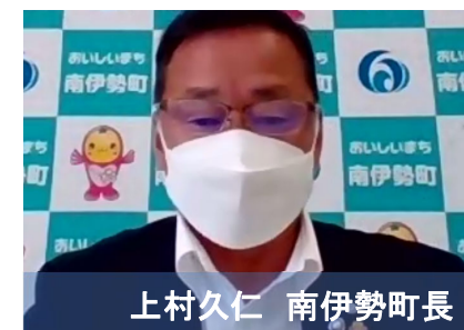
上村久仁 南伊勢町長