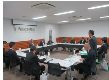
第14回勢田川等水面利用対策協議会の様子

協議会は、勢田川、五十鈴川、大湊川及び宇治山田港における水面・水際の良好な船舶等の係留環境の促進・整備等を行うことにより、水面の安全かつ秩序ある利用の維持・増進を図ることを目的としています。