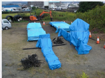
保管状況(勢田川排水機場敷地内)