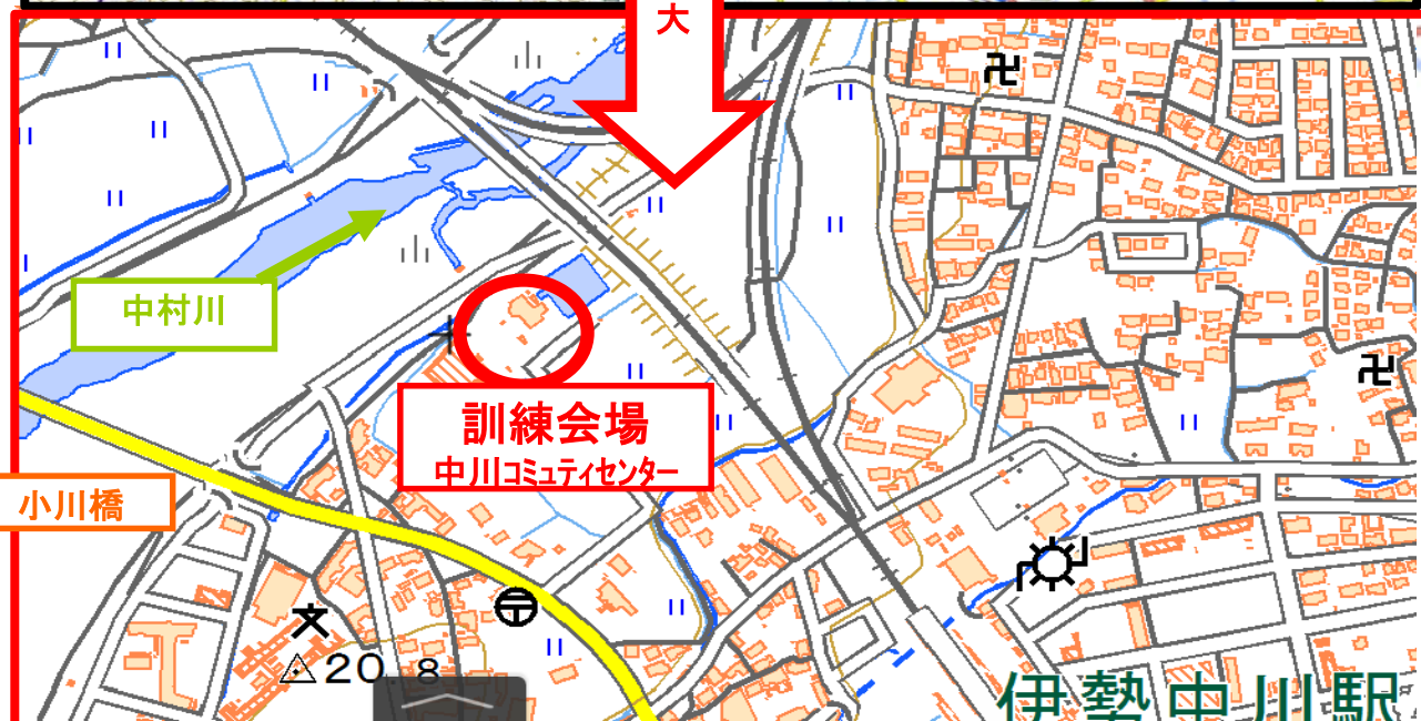
～訓練スケジュール～