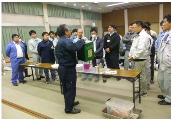
【講習】油類による水質事故対応