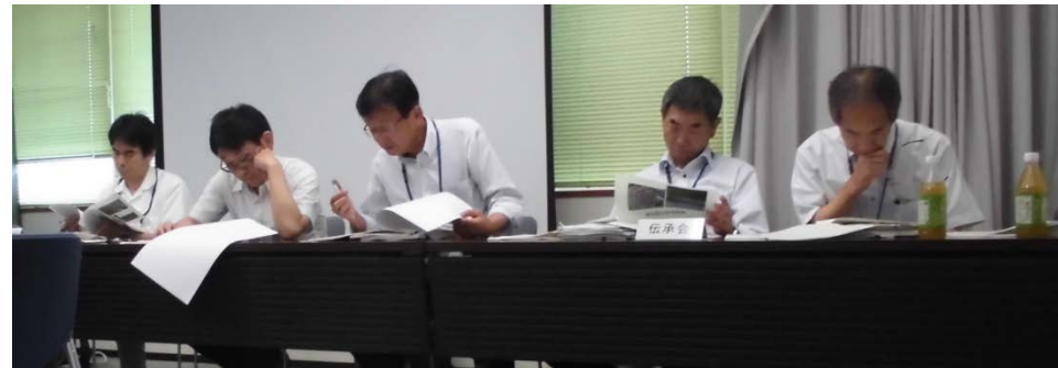
各班の検討状況について評価する河川工法伝承研究会の皆さん