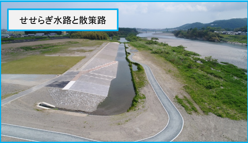
せせらぎ水路と散策路