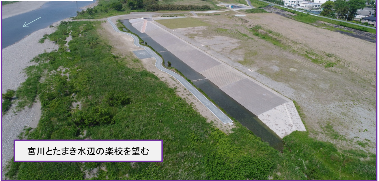
宮川とたまき水辺の楽校を望む