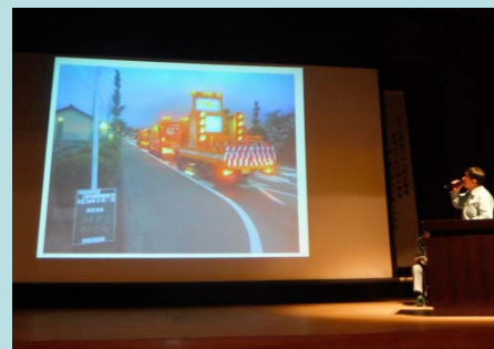
四日市国道支部報告