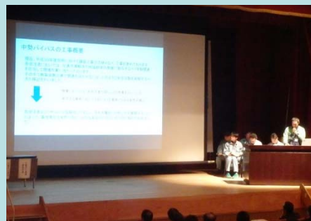
鈴鹿国道支部報告