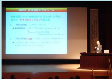
事務担当副所長 コンプライアンスについて