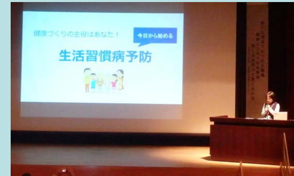
津市 安全は健康から