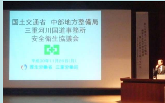
三重労働局 第13次労働災害防止計画