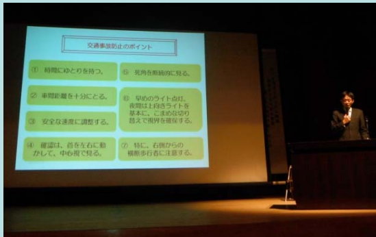
三重県警本部 交通事故情勢と交通事故防止対策