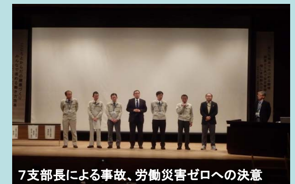
7支部長による事故、労働災害ゼロへの決意