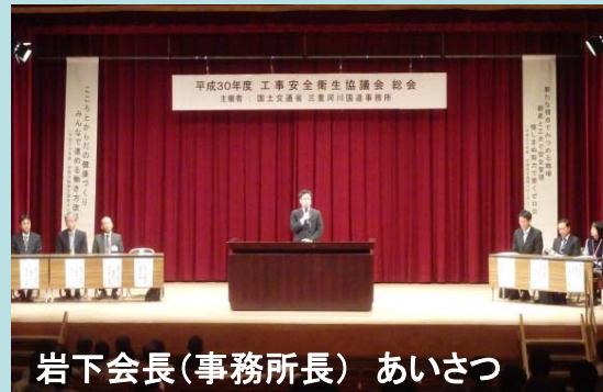
岩下会長(事務所長) あいさつ