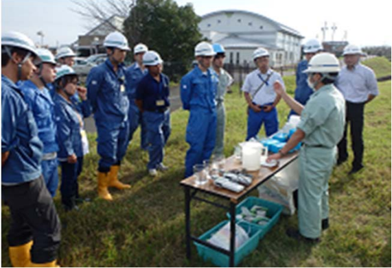
【実習】パケットテスト(簡易水質検査)