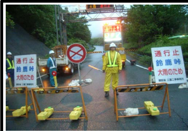
【沓掛ゲート】 大雨による通行止めの様子