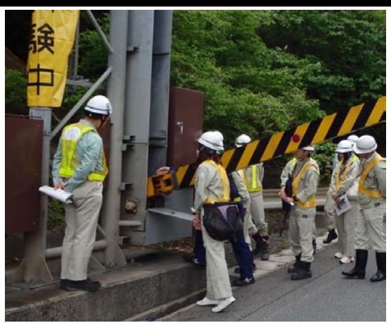
【沓掛ゲート】 遮断機操作盤の手順確認訓練