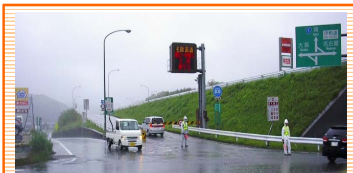
※下り(大阪方面)関IC乗り口での通行止めの様子