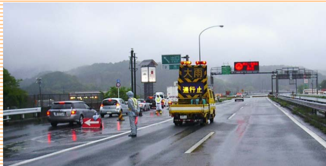
※本線上での通行止めの様子