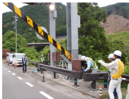
操作訓練の実施場所・昨年の実施状況 (左)荷坂ゲート (右)南浦ゲート