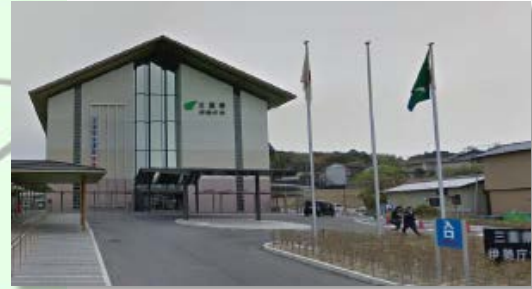
三重県伊勢庁舎 (伊勢市勢田町628番地2)