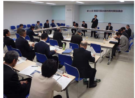
第11回勢田川等水面利用対策協議会の様子

協議会は、勢田川、五十鈴川、大湊川及び宇治山田港における水面・水際の良い船舶等の係留環境の促進・整備等を行うことにより、水面の安全かつ秩序ある利用の維持・増進を図ることを目的としています。