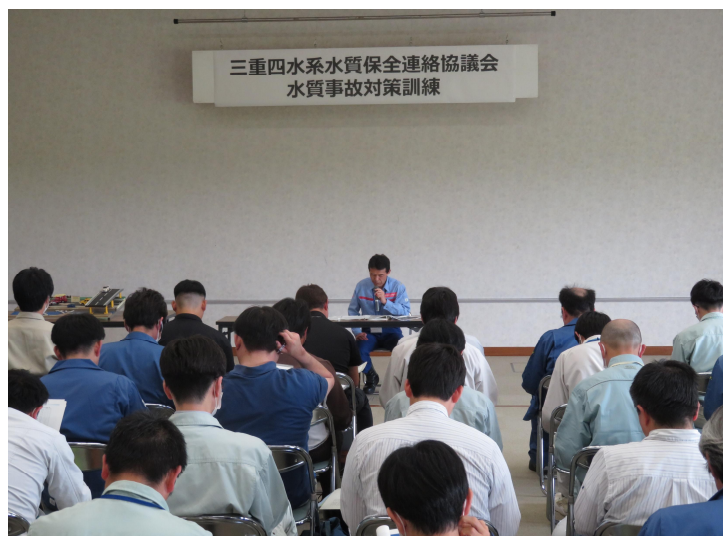
【講習】水質事故対応の基礎説明