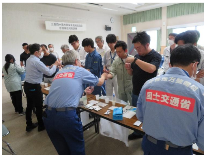
【実習】簡易水質検査(パケットテスト)