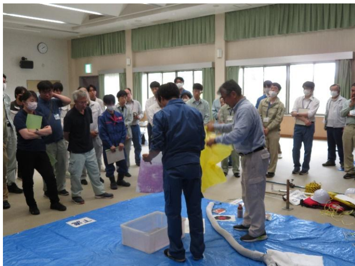
【実習】油の特性と基本的な対策