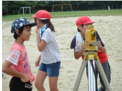
(測量機器の展示イメージ)