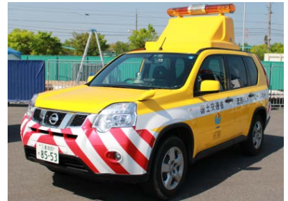
(道路パトロールカー)