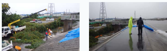
津市高茶屋排水状況