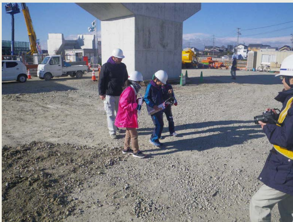
小学生による使用状況

予め,CAD図面を設定し、現地でプリズムに装着したスマートフォンとGPSで連携させると、画面上に杭打ちを行うべき点を表示させることができます。