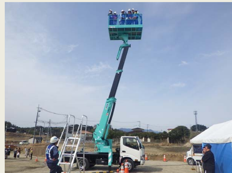
高所作業車 乗車体験