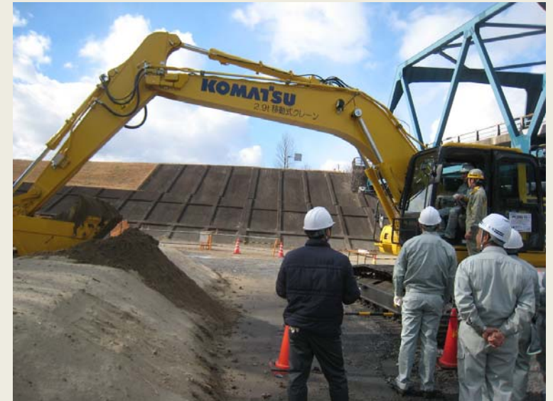
ICT建機での法面掘削・整形の様子