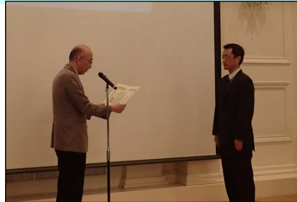
認定書授与式の状況