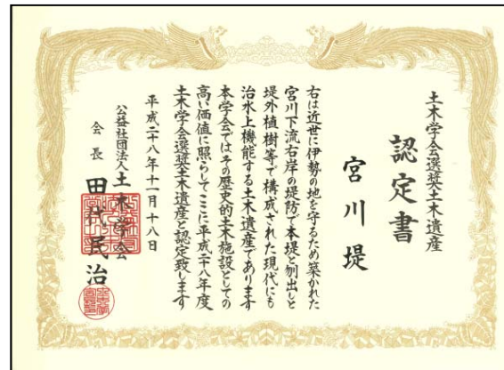
土木学会選奨土木遺産 認定書