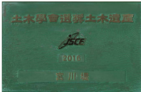
土木学会選奨土木遺産 プレート