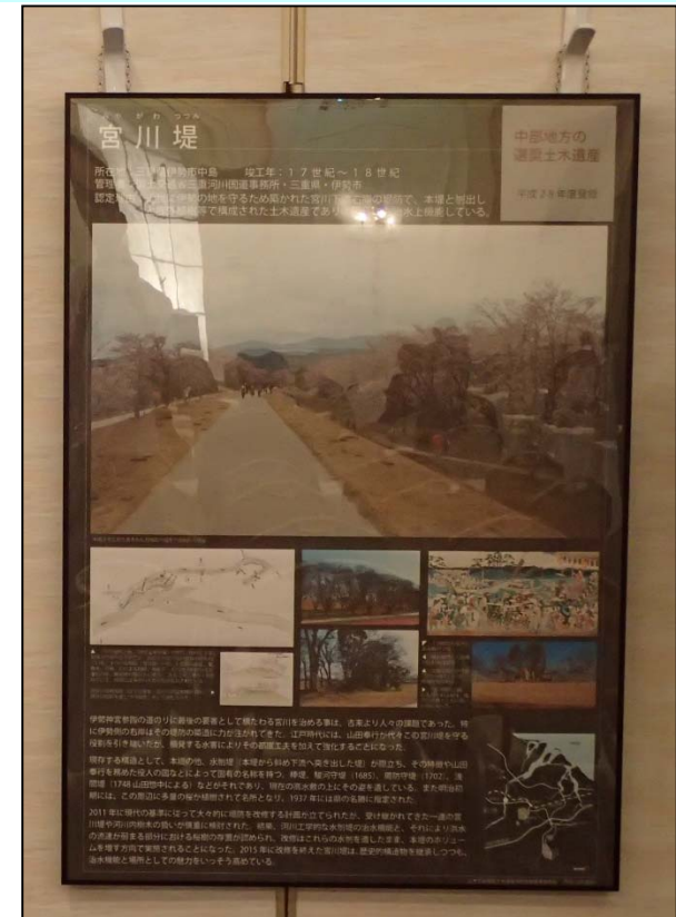
会場掲示ポスター(土木学会作成)

土木遺産に関することは土木学会選奨土木遺産のHP ( http://www.jsce.or.jp/contents/isan/ ) をご覧下さい。