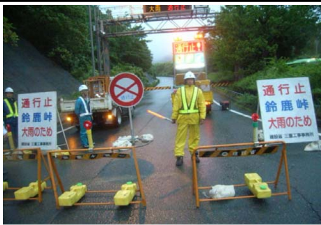
【沓掛ゲート】 大雨による通行止めの様子