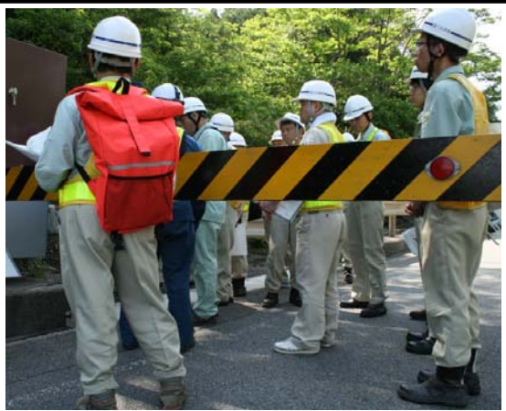
【沓掛ゲート】 遮断機操作盤の手順確認訓練