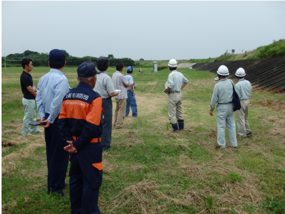
【櫛田川合同巡視の状況】