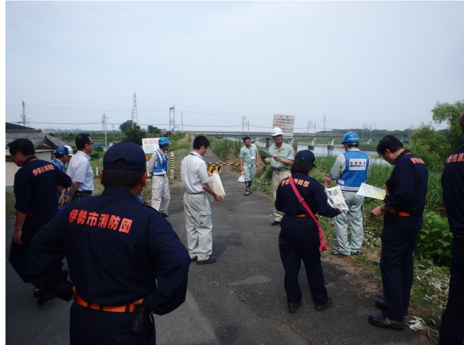
【宮川合同巡視の状況】

「重要水防箇所」とは 水防関係者が、洪水時の巡視を行う際に効率的な点検が実施できるようにあらかじめ堤防の高さや堤防の幅、過去の漏水等の実績などから水防上、重要な区間を定めたもの。