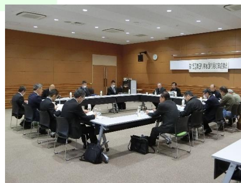
第15回勢田川等水面利用対策協議会の様子

本協議会は、勢田川、五十鈴川、大湊川及び宇治山田港における水面・水際のご良好な船舶等の係留環境の促進・整備等を行うことにより、水面の安全かつ秩序ある利用の維持・増進を図ることを目的としています。