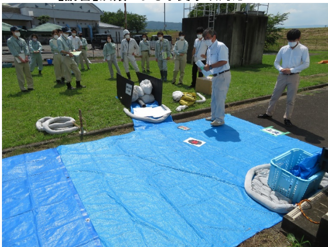
【講習】油類による水質事故対応