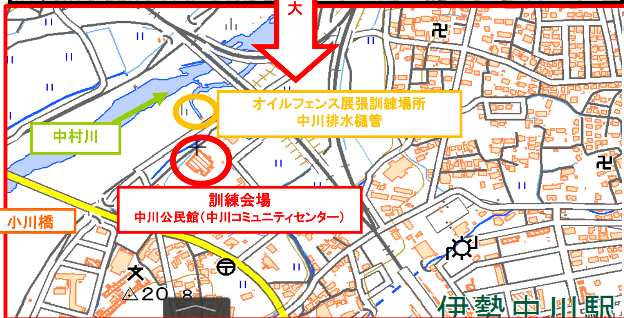
～訓練スケジュール～