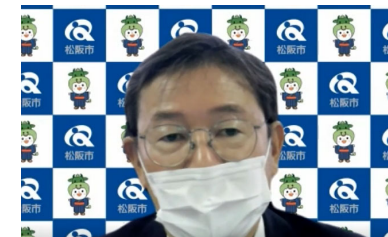
竹上真人 松阪市長