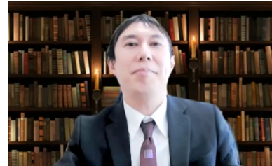
柴田孝之 菰野町長