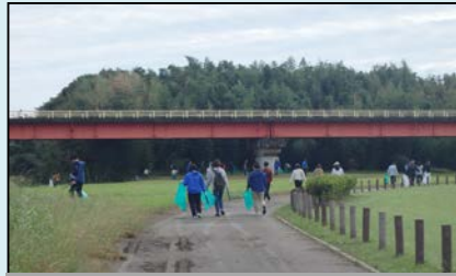
鈴鹿川河川緑地公園(鈴鹿市)