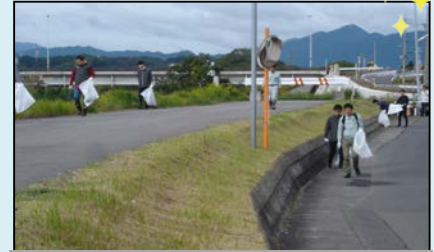
鹿島橋付近(亀山市)