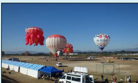
バルーン飛行の状況

11月22日から24日にかけて鈴鹿川河川緑地で鈴鹿バルーンフェスティバルが開催され、23日には三重河川国道事務所も参加しました。鈴鹿川で働く建設業の皆さんに協力してもらい、大盛況でした！