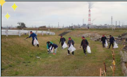
鈴鹿川緑地公園(四日市市)

鈴鹿川水系では、10月20日に亀山市と鈴鹿市内、11月24日に四日市市内でクリーン大作戦を実施し、合計で2tダンプ8台ほどのゴミが集まりました。参加して頂いた地域のみならず、ありがとうございました！