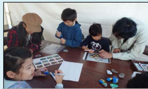
ストーンアート作り