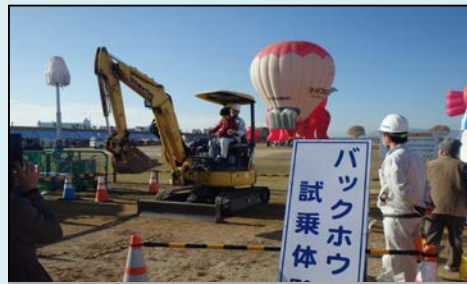
ブルドーザーの試乗体験