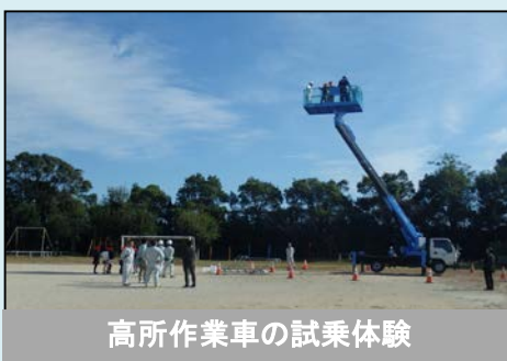
高所作業車の試乗体験