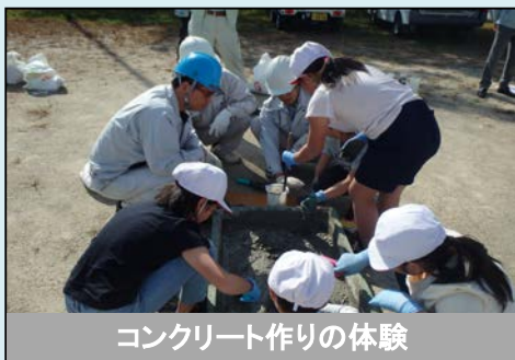
コンクリート作りの体験