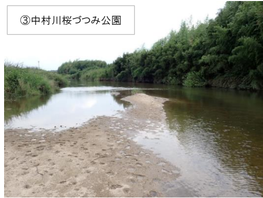
③ 中村川桜づつみ公園