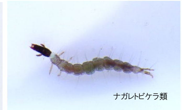
ナガレトビケラ類