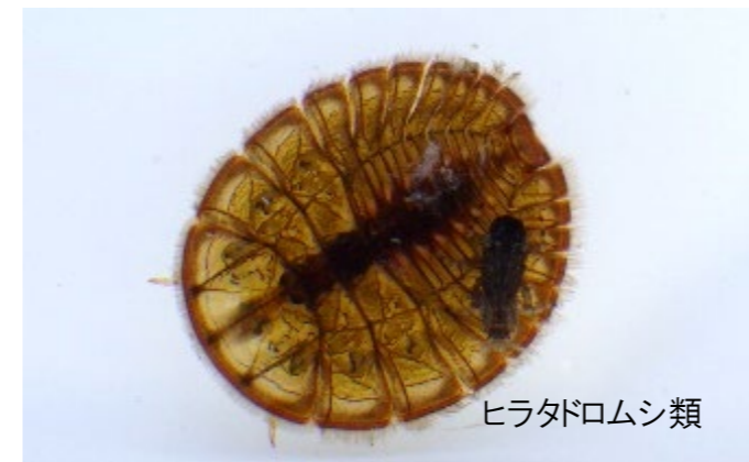
ヒラタドロムシ類