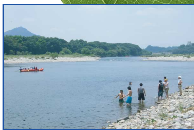
いつまでもきれいな水辺