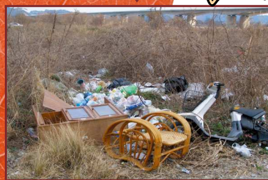
ますますゴミが増える