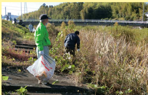
R 2 年度の実施状況