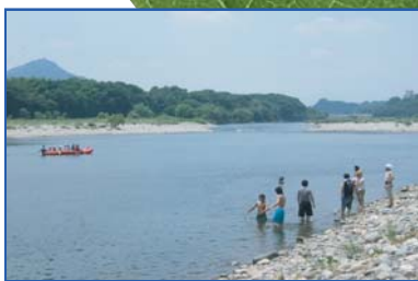
いつまでもきれいな水辺