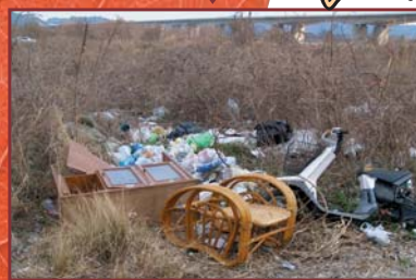
ますますゴミが増える