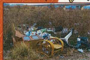
ますますゴミが増える