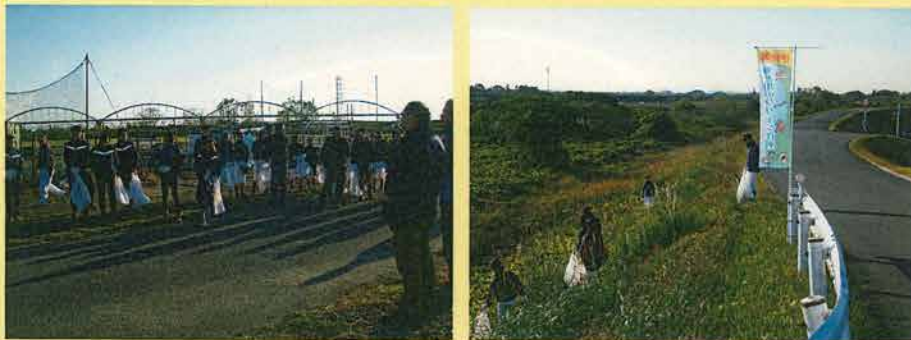
昨年度の実施状況