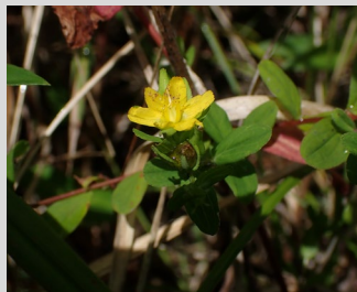
桜づつみ公園の開花個体

夏の調査では、移植地で草刈りも実施しました。アゼオトギリより背丈が伸びた植物の上層部を手で切り取り、適度な日光が差し込むようにしました。きれいな花を咲かせ、種子をつけてほしいです！