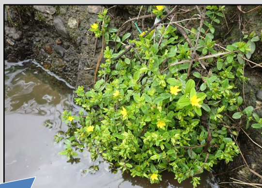
水路内に立派なアゼオトギリの花が咲いていました♪