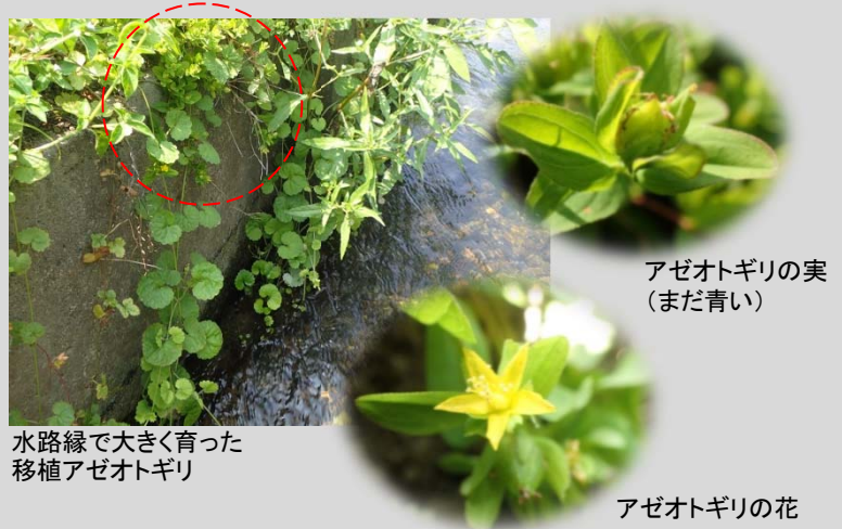
水路縁で大きく育った移植アゼオトギリ

いい傾向です。このまま、できるだけ除草剤を使わずに定期的に草刈りをお願いいたします！