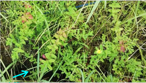
水路 水路縁にて旺盛に育った移植アゼオトギリ(写真全面)