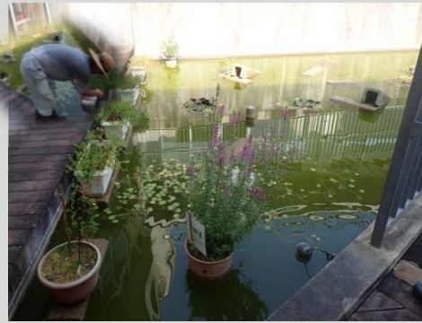
佐奈小学校 校内の池

仁田地域環境保全会と佐奈小学校の子供たちと協力して校内の池に少しづつ植物を増やしています。