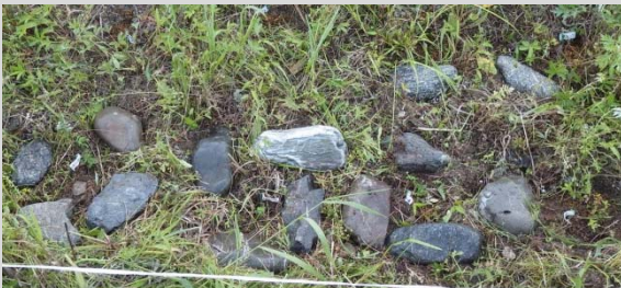
移植したアゼオトギリを挟むように石を置いた

ある日、「他の植物が育ちにくい石のすき間は、アゼオトギリにとって育ちやすいのでは？」とのご意見を聞き・・・さっそくやってみました！移植したアゼオトギリを手のひら大ほどの石で挟んでみました。育つといいなあ♪