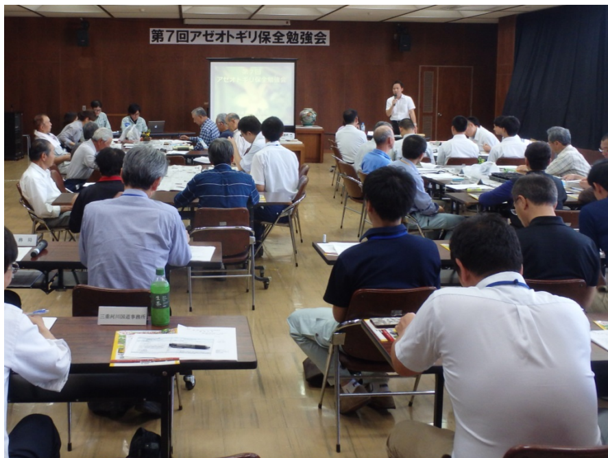
アゼオトギリ保全勉強会（多気町役場）

◆参加機関：三重大学教育学部、三重県立相可高等学校、三重県立久居農林高等学校、福井県立坂井高等学校、兄国水と緑を守り隊、西池上やまびこ会、仁田地域環境保全会、べこじ倶楽部、佐奈川を美しくする会、多気町、三重河川国道事務所、三重県農林水産部 他 総勢約50名