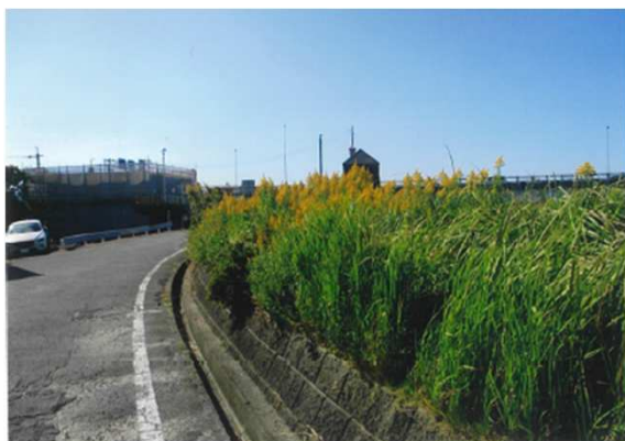
通町 (右岸) 10月末 除草前