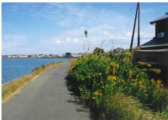
通町 (右岸) 10月末 除草前