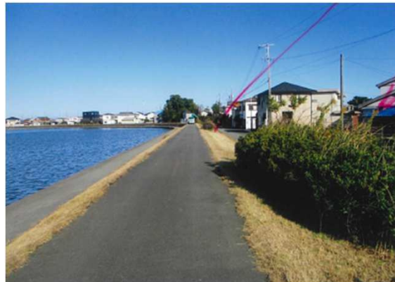
通町～一色町 (右岸) 11月1日 除草後