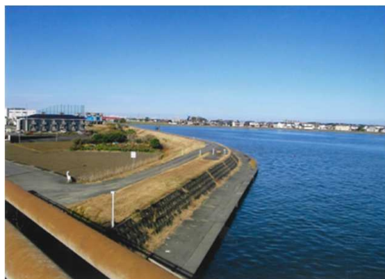
田尻町 (左岸) 11月1日 除草後