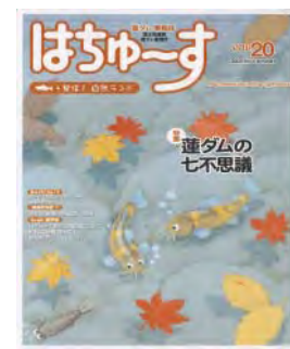
蓮ダム広報誌「はちゅーす」