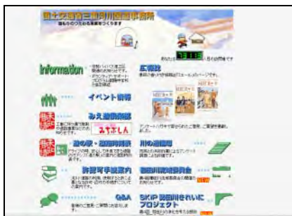
三重河川国道事務所ホームページ

さらに、水生生物調査など自然体験活動等の機会を通じて身近な自然である櫛田川に親しみ、将来を担う子供たちへの環境教育を積極的に支援するなど、広く地域住民に櫛田川に対する関心を高めるための活動を行う。