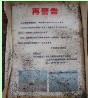
周辺護岸に注意書・警告書を貼付