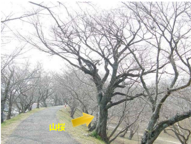
残念ながら保全できないこととなった山桜（境楠付近）