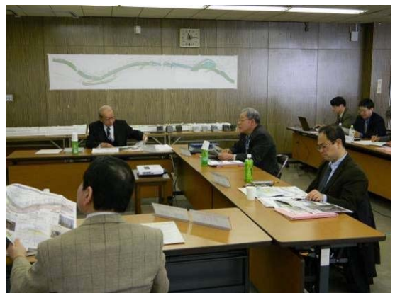
第3回宮川右岸堤防改修景観検討委員会の様子