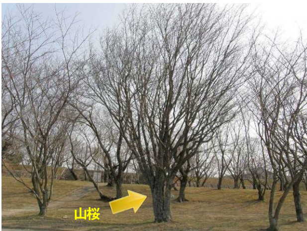
工事で伐採されずにすむ別の山桜