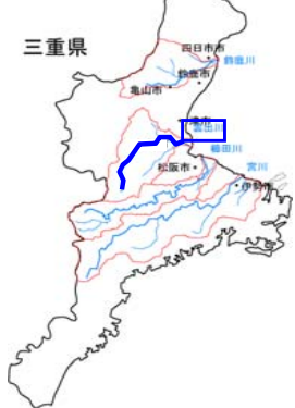
要配慮者施設における避難確保計画の作成促進（津市）